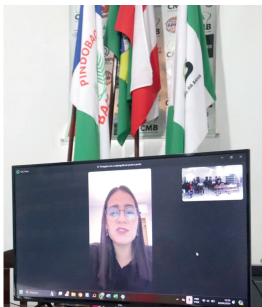
Engenheira ambiental participou por videoconferência