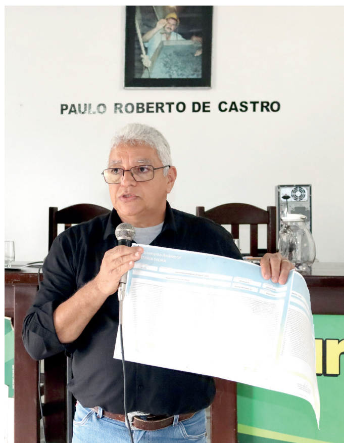
Presidente da CMB falando das condicionantes da LO